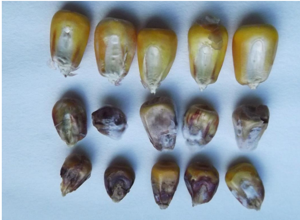
2. ábra. A csutka felől fertőződött szemek némelyike felülről nem mutat elváltozást (ez csövön nézve egészségesnek látszik), másoknál a betegség már a teljes szemet átfogta. Felső sor: kontroll.

Összefoglalásként megállapíthatjuk, hogy a három kórokozó faj közötti reakció nem függ össze szorosan egymással. A két Fusarium faj között laza, de többnyire szignifikáns kapcsolat van, azonban az Aspergillus reakciók kilógnak a sorból, vagy nincs összefüggés, vagy mint a rangsor korrelációnál láttuk, az negatív lett. Az adatok igazolták azt, hogy az Aspergillus korábban mesterséges és természetesnek szétválasztott fertőzését célszerű összekapcsolni, és egyben kezelni. Ez egyben a fertőzés, ill. az aflatoxin kapcsolatok jobb nyomon követését is biztosítja. A toxinmérés alapvető fontosságú, így a téves ítéletet még idejében korrigálni lehet. Azt gondolom, hogy ezek az adatok segítséget fognak adni a következő szezon(ok) hibridválasztékának kialakításához.