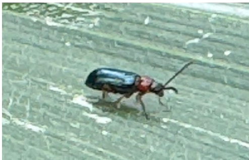
2. kép: Vetésfehérítő bogár, (vörösnyakú árpabogár, Oulema melanopus )

A kísérlet kivitelezésére visszavezethető technológiai hibát nem láttam.