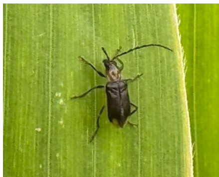
1. kép: kukoricabogár imágó

A tábla szélén a kukoricát a szél megnyomta, a szélső növényeken gúnárnyak-tünet látszott. A kocsiból kiszállva az első kukoricalevélen kukoricabogár-imágót találtam.