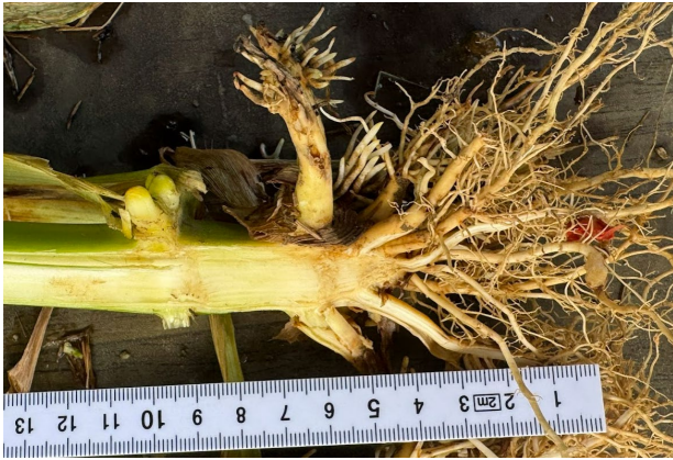
4. kép: Kukoricabogár lárvakártétel. A képről leolvasható, hogy a vetés kb. 6 cm mélyre történt.

A tőhiány — 100%-os csírázóképessegre visszavetítve — 0 és közel 40% között alakult. A keléshez szükséges feltételek a kísérletben megfelelőek voltak, a kelés általában egyenletesnek látszott. A hiányhelyek és a gyengébb fejlettségű növények aránya ezért inkább hibridspecifikus jelenségként értelmezhető. A betakarítási eredmények várhatóan jól megmutatják majd az egyes hibridek produkciós és állományhiba-kompenzáló képességét. A parcellák közötti növényállomány-különbségek sem számban, sem fejlettségben nem köthetők talaj- vagy agrotechnikai hibához.