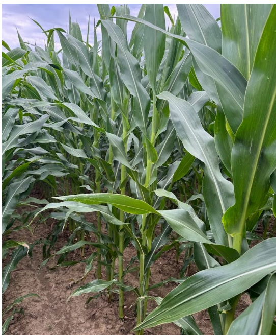
2. kép: a FAO300 csoport kezdőparcellájának részlete

A növényállomány gyommentes és egészséges képet mutatott, ugyanakkor a gyökérszeten jól látható volt a kukoricabogár-lárva kártétele. Kukoricamolylehatolást és elhalt levéltetű-maradványokat csak elvétve találtam, ami arra utal, hogy a földfelszín feletti rovarkártevők elleni védekezés összességében működött.